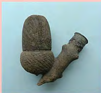
Een houten tabakspijp in de vorm van een eikel Pagina 19