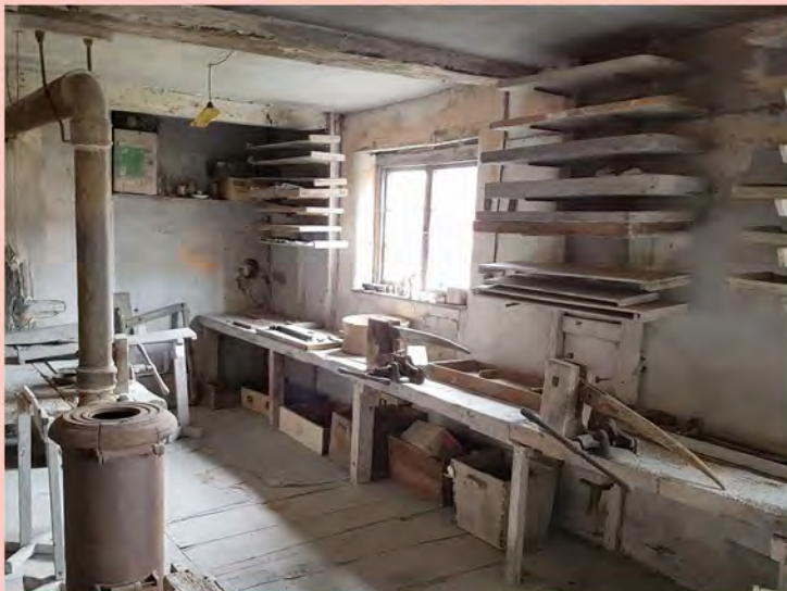
Stoke-on-Trent Verslag van de AIP en SCPR conferenties in Engeland (2017) Pagina 22