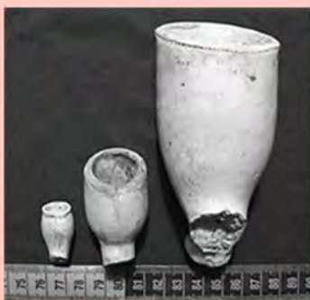
De kleine en de grote reuzenpijp Pagina 9